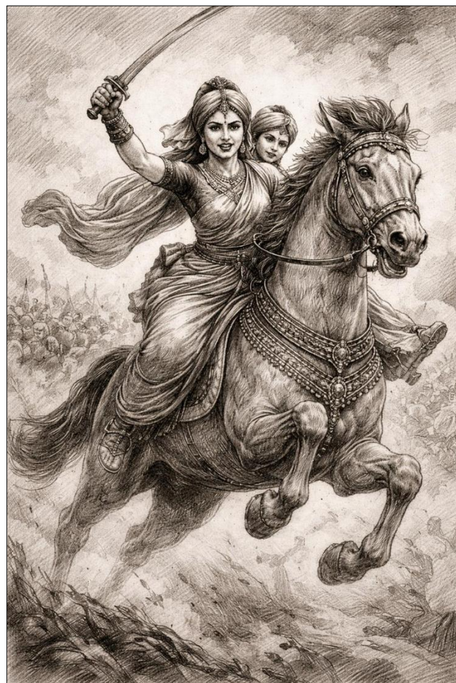
चित्र 1: महारानी लक्ष्मीबाई की काल्पनिक फोटो